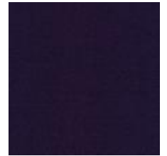
Audyns Boss 71 Plum 1003571