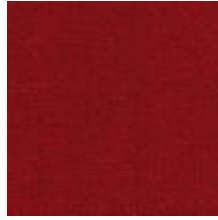
Audyns Boss 21 Brick 1003521