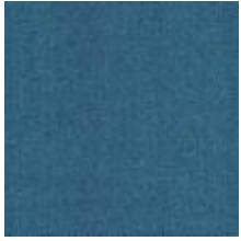
Audyns Boss 12 Sky 1003512