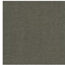
Audyns Boss 66 Mole 1003566