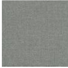
Audyns Boss 17 Warm grey 1003517