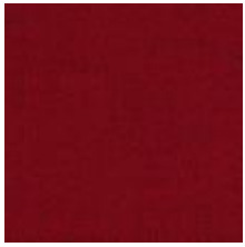
Audyns Boss 1 Red 1003501