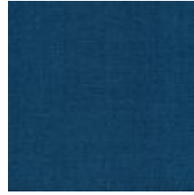
Audyns Boss 22 Petrol 1003522