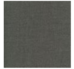
Audyns Boss 7 Steel 1003507