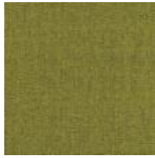
Audyns Boss 3 Garden 1003503