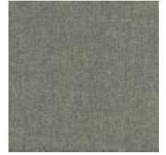
Audyns Boss 26 Beige 1003526