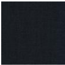
Audyns Boss 96 Dark brown 1003596