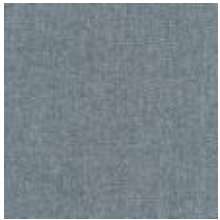
Audyns Boss 27 Aluminion 1003527