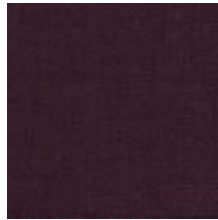
Audyns Boss 61 Vinrod 1003561