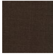
Audyns Boss 6 Brownie 1003506