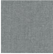
Audyns Boss 16 Linen 1003516