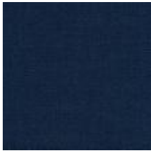
Audyns Boss 2 Ocean 1003502