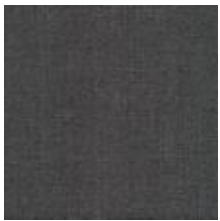
Audyns Boss 86 Nougat 1003586