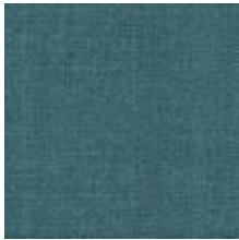
Audyns Boss 32 Lagun 1003532