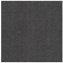
Audyns Boss 86 Nougat 1003586