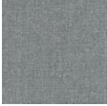
Audyns Boss 16 Linen 1003516