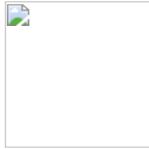
Audyns Boss 46 Coffee 1003546