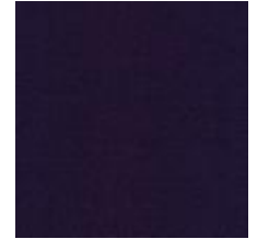
Audyns Boss 71 Plum 1003571