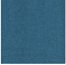
Audyns Boss 12 Sky 1003512