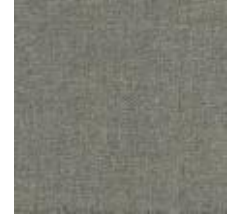
Audyns Boss 26 Beige 1003526