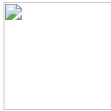
Audyns Boss 46 Coffee 1003546