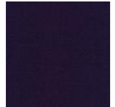
Audyns Boss 71 Plum 1003571