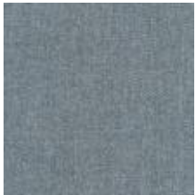
Audyns Boss 27 Aluminion 1003527