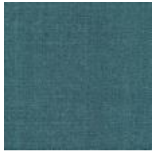
Audyns Boss 32 Lagun 1003532