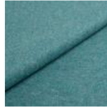
Audinys Wooly Trend 22882287 Aquamarin 1039031