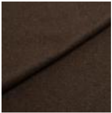
Audinys Wooly 1010 Forest 1038823