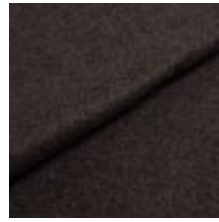
Audinys Wooly 1002 Koks 1038804