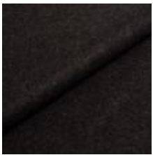
Audinys Wooly 1003 Black 1038844