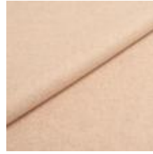
Audinys Wooly 1037 Sand 1038816