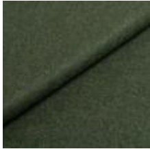
Audinys Wooly Trend 840069 Juniper 1039028