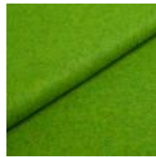
Audinys Wooly Plus 2269 Emerald 1039004