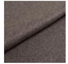
Audinys Wooly 1042 Grafite 1038807