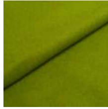
Audinys Wooly 2079 Green 1038813