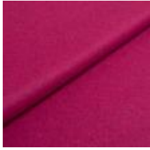
Audinys Wooly 1044 Cerise 1038811