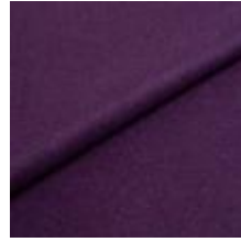
Audinys Wooly Plus 0091 Berry 1039017