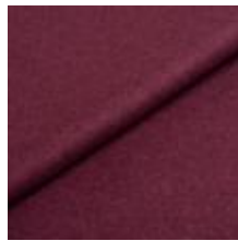
Audinys Wooly 2238 Aubergine 1038861