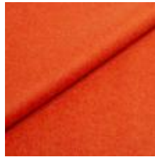
Audinys Wooly 2012 B Terra 1038831