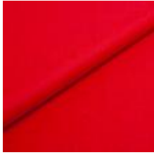
Audinys Wooly Plus 2011 B Red 1039015