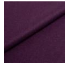
Audinys Wooly 2255 Dark lilac 1038891