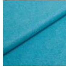
Audinys Wooly Plus 0106 Turquoise 1039018