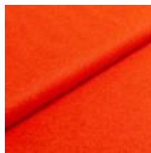
Audinys Wooly Plus 9145 Pumpkin 1039010