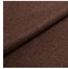
Audinys Wooly 1008 Brown 1038806