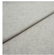
Audinys Wooly Plus 2256 Ivory melange 1039005