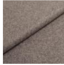
Audinys Wooly 1000 Light grey 1038817