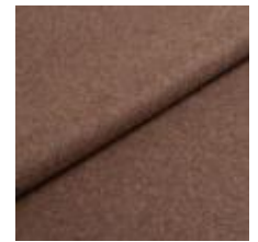
Audinys Wooly Plus 9202 Taupe 1039007