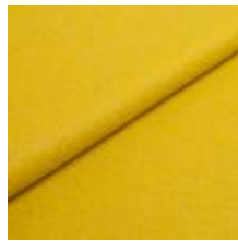
Audinys Wooly Plus 9759 Leaf 1039003