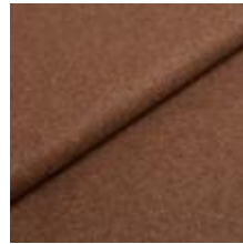
Audinys Wooly 1026 Light brown 1038836