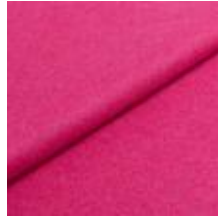
Audinys Wooly Plus 9872 Pink 1039016