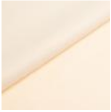
Audinys Wooly 1016 Bone 1038810