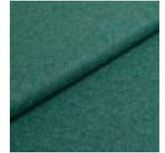
Audinys Wooly Trend 842287 Lagoon 1039032