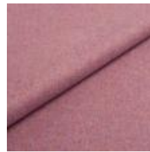
Audinys Wooly 2020 Lilac melange 1038881