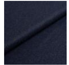
Audinys Wooly 1007 Navy 1038842