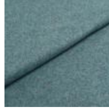
Audinys Wooly Plus 2288 Soda 1039024