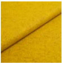
Audinys Wooly Plus 2270 Lime 1039001