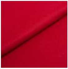
Audinys Wooly 2142 Raspberry 1038801