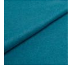
Audinys Wooly 2240 Petrol 1038822