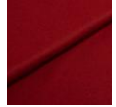
Audinys Wooly Trend 2301 Marsala 1039026