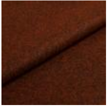
Audinys Wooly Plus 2153 Java melange 1039014