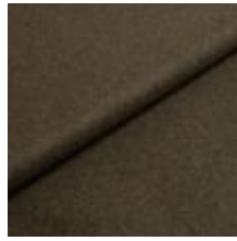
Audinys Wooly 1011 Bottle green 1038803