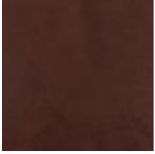
Oda Olive leaf Vitoria Mahagoni 1100917