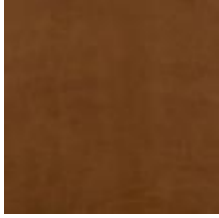
Oda Olive leaf Vitoria Tabac 1100918