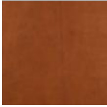
Oda Olive leaf Vitoria Saddle 1100909