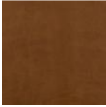
Oda Olive leaf Vitoria Tabac 1100918