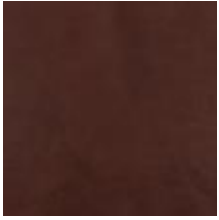
Oda Olive leaf Vitoria Mahagoni 1100917