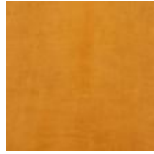
Oda Olive leaf Vitoria Maple 1100920