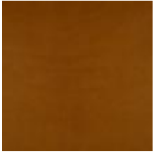
Oda Olive leaf Vitoria Cognac 1100907